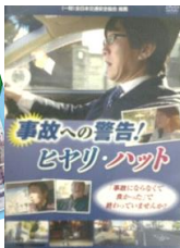
研修で使ったDVDと事例集